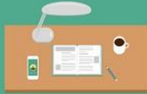
مطالعه در کتابخانه