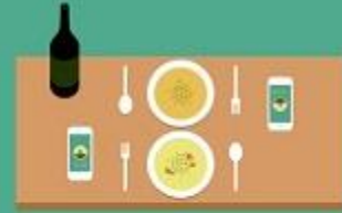
همراه با دوستان